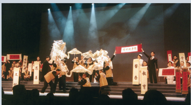
▲二〇〇一年《靜思寰宇慈濟情》音樂手語劇，引領觀眾瞭解慈濟的人文與大愛精神，並將義演所得全數捐予希望工程。