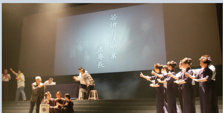
▲二〇〇三年《藥師如來十二大願》音樂手語劇，詮釋藥師佛的智慧與慈悲濟世願力。