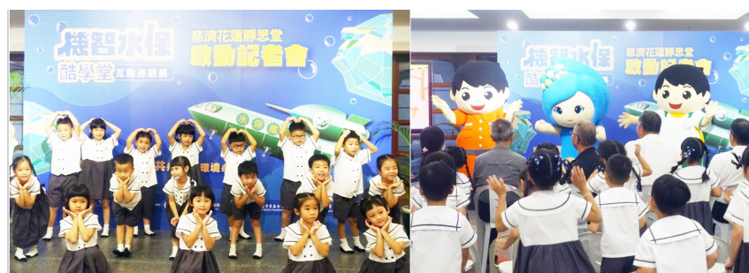
▲開展儀式上，慈大附中附設幼兒園學生、農村水保署吉祥物以活潑的歌曲歡喜帶動。

花蓮訊 ／農業部農村發展及水土保持署（以下簡稱「農村水保署」）與慈濟基金會共同舉辦「機智水保酷學堂」互動巡迴展，十月十八日下午在花蓮靜思堂正式展開，由農村水保署副署長林長立、花蓮分署分署長林宏鳴、臺北分署副分署長洪繼懋，以及慈濟基金會副執行長劉效成等人啟動開展儀式，展至十二月十七日，為期兩個月。