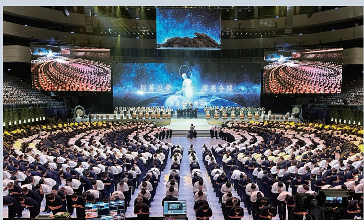
▲二〇二三年《無量義 法髓頌》，以善以愛照亮全球，為天下祈福。