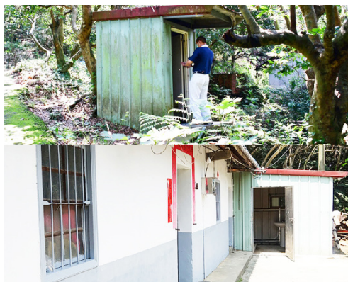
▲修繕前（上），徐阿嬤上廁所要走很遠；修繕後（下），志工為阿嬤搭建新衛廁。