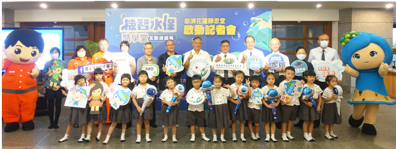
▲農村水保署與慈濟舉辦「機智水保酷學堂」互動巡迴展，十月十八日下午在花蓮靜思堂正式展開。