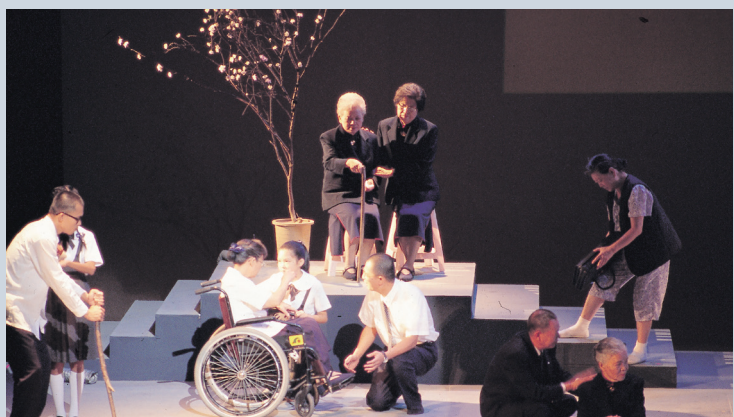
▲二〇〇二年《父母恩重難報經》音樂手語劇，透過戲劇、手語、歌唱，詮釋父母對子女的真情。