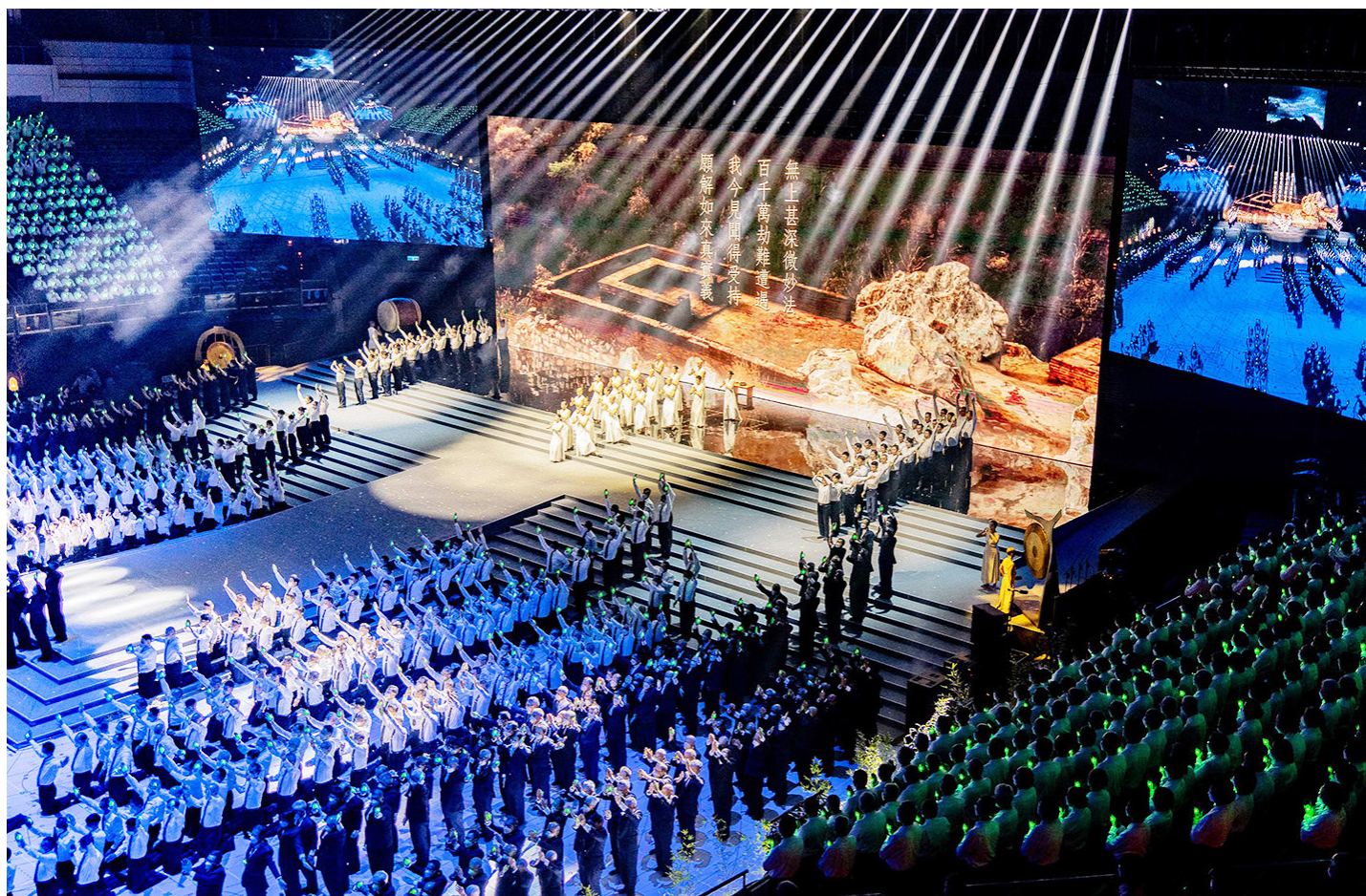
▲《以善以愛照亮全球 無量義法髓頌》經藏演繹，結合藝術與佛法，啟發人心，為全球祈福。

臺北訊 / 《以善以愛照亮全球 無量義法髓頌》經藏演繹，十月廿日至十月廿二日連續三天於臺北小巨蛋演出，將藝術與佛法結合，藉由唱頌、手語、音樂劇的方式詮釋經典，並將慈濟人間菩薩行跡和佛陀經文緊密結合，讓入經藏者能將經典深刻印心，引起觀眾共鳴，並在優人神鼓撼動人心的鐘鼓齊鳴下，為全球祈福。