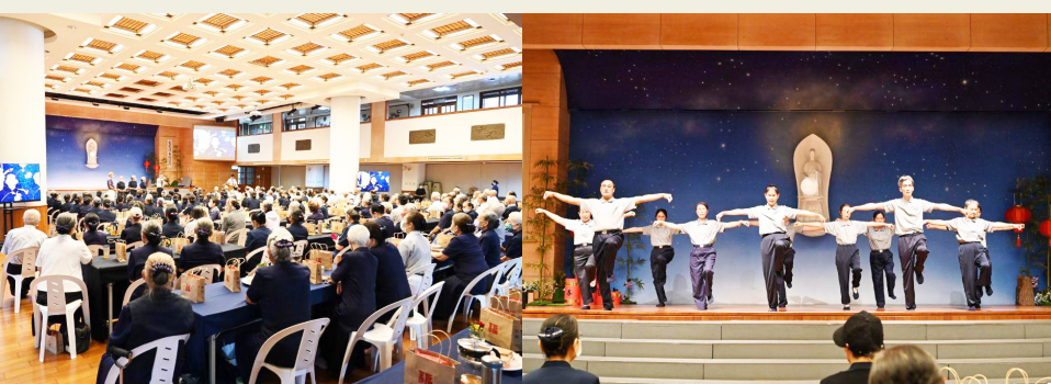
（文：陳淑貞、吳麗珍）

臺南訊／為表達對資深年長慈濟志工的敬愛，慈濟臺南分會在十月廿一日舉辦重陽聯誼，現場一百多位資深、年齡都在六十五歲以上的志工歡聚一堂。許多長者志工們見到三、四十年前的老朋友非常開心，當年並肩打拚的場景彷彿如昨日歷歷在目。聯誼會中，除了音樂饗宴、老照片回顧、慈濟路分享，也以「大地和風拳」健康操舒展筋骨，希望能帶給長者們身心舒暢、常保健康活力。