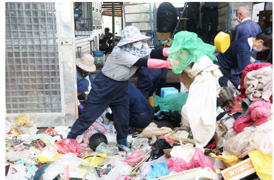
▲屋內堆滿回收物垃圾，慈濟志工合力將堆積的物品移往屋外做分類。

嘉義訊／二〇二〇年個案楊先生為照顧生病住院的父親，以致經濟發生困難，慈濟基金會曾以急難補