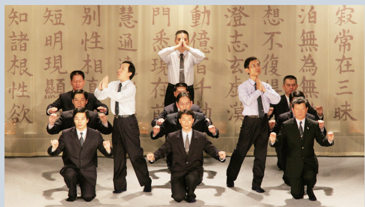
▲二〇〇六年《清淨 大愛 無量義》音樂手語劇，詮釋慈濟人深入《無量義經》精髓，行入人間力行菩薩道。