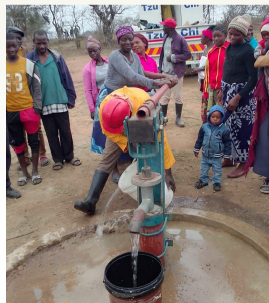
◀慈濟團隊邀請當地民眾一起修繕水井，並提供淨水藥。

二〇一七年辛巴威卡札地區(Zaka)水患，慈濟發送大米與淨水藥及時協助災區民眾，也希望減少傷寒與霍亂的傳染。慈濟的投入深獲卡札地區政府與民眾信任。今年十月慈濟基金會受託協助修繕當地損壞的四十五口水井，因為當地霍亂疫情正在蔓延。