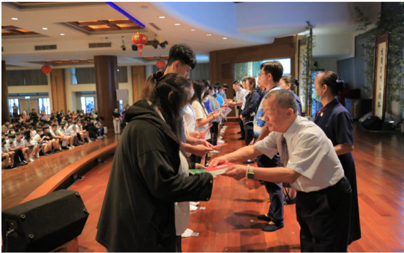
▲慈濟新芽獎學金頒獎典禮開跑，獲獎學子接受貴賓、師長的祝福。

臺北訊 / 證嚴上人常比喻，家庭辛苦的孩子若能得到幫助，會像蒲公英一樣即便落在貧瘠的土地上，也會長出新芽。慈濟基金會以扶困助學為目標，成立「新芽獎學金」，希望作為學子求學路上的堅實後盾。 受疫情影響，停辦兩年的新芽獎學金實體頒獎典禮，今年再度舉行，十月十四日慈濟基金會在苗栗慈濟園區、臺中、豐原、清水靜思堂、臺中民權、大里聯絡處、彰化分會、南投聯絡處等地，舉行首日頒獎典禮，全臺各縣市也將在十月底前陸續舉辦，總計會有三十一場頒獎典禮，九千多名學子受惠。