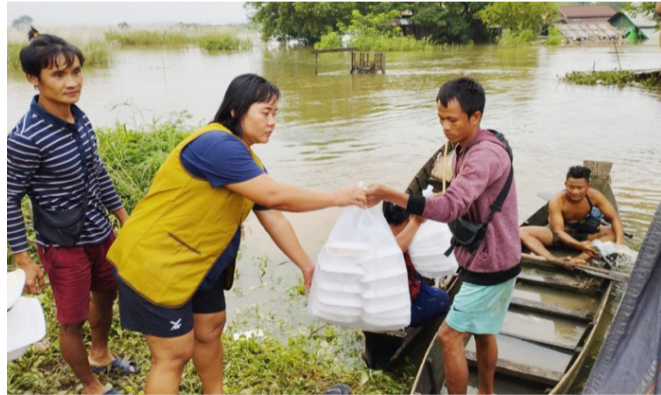
▲慈濟志工在安全的前提下，想盡一切通行的辦法，親送熱食給災區民眾。

緬甸訊／十月緬甸大雨釀災，民眾苦不堪言，水上人家不再覺得居於水上有任何愜意之情，而是充滿無奈與無助。慈濟志工為了讓災區民眾能夠吃到熱食，只要能前往的區域，志工會利用小船進入送食，就是一心希望居民收到熱食，能夠暖胃，也暖心。