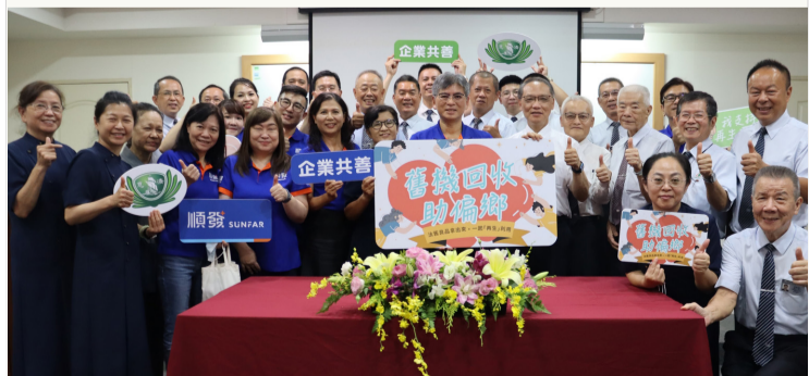
▲共善專案由順發科技捐贈回收電腦或零配件，經慈濟再生電腦團隊整修後，無償贈送給弱勢家庭學童及其他社會福利機構使用。