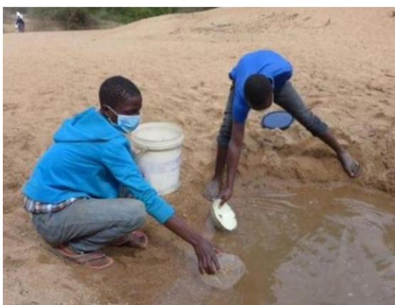
▲圖中的泥水也是許多辛巴威民眾仰賴的飲用水源之一。

辛巴威訊 / 非洲辛巴威，民眾受霍亂疫病威脅。據官方統計，至今已有五千多起病例，一百多起死亡案例。霍亂弧菌多經由飲用不淨水而感染，辛巴威地區民眾取水普遍辛苦，許多居民沒有乾淨水喝。慈濟基金會受辛巴威扎卡區 (Zaka) 地方之請，協助修繕當地水井，截至十月十四日已完善三十四口水井修建，並提供淨水方法。估計受惠約五萬九千五百人。（資料來源：慈濟基金會宗教處）