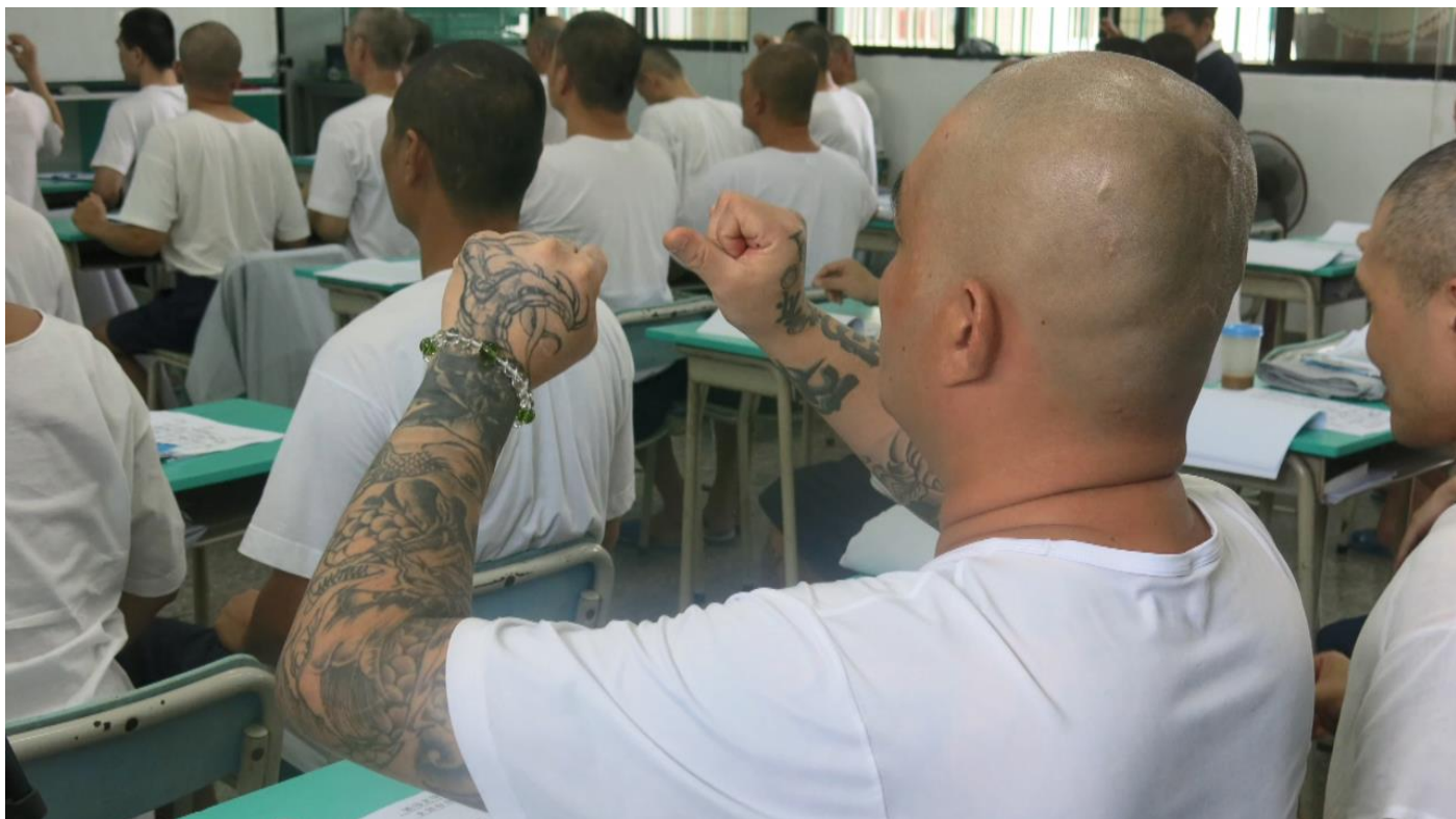
圖四：屏東監獄入經藏，獄友刺龍刺鳳的手臂，比劃起手語，一樣莊嚴、有力。