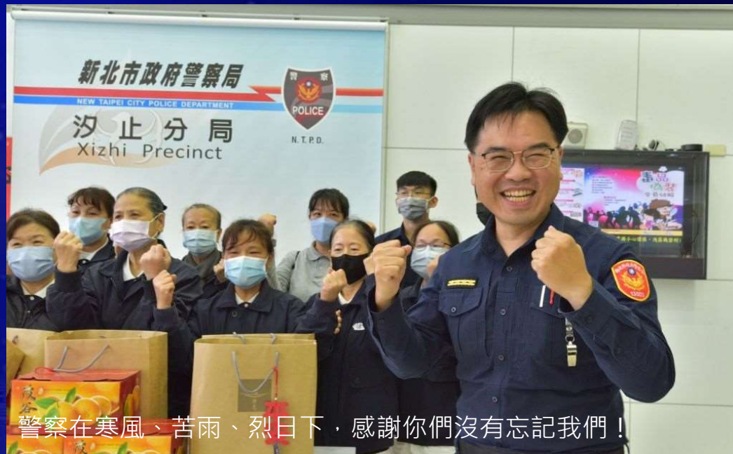
警察在寒風、苦雨、烈日下，感謝你們沒有忘記我們！