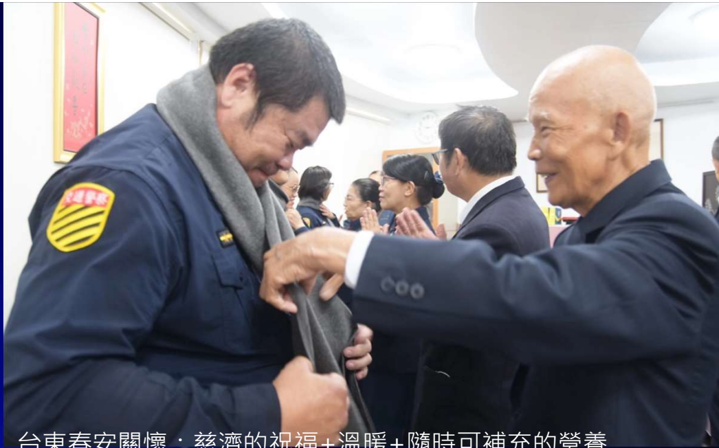
台東春安關懷：慈濟的祝福+溫暖+隨時可補充的營養